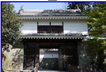
飫肥城観光駐車場 12:25