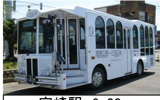
宮崎駅 9:00 観光バス「にちなん号」