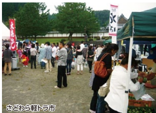
さどわら軽トラ市