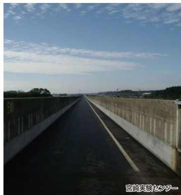
宮崎実験センター

平成8年までリニア走行試験が行われていた、宮崎実験センターを楽しめるコースです。また「クルーズトレインななつ星in九州」でも散策されている美々津の街並みもお楽しみいただけます。