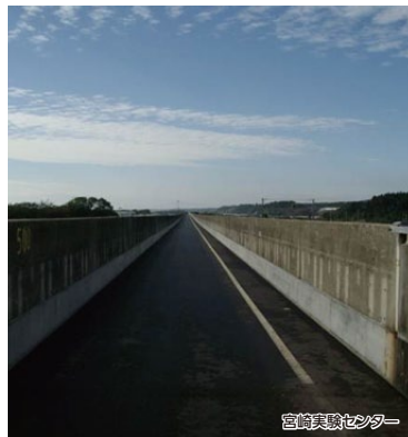
宮崎実験センター

平成8年までリニア走行試験が行われていた、宮崎実験センターを楽しめるコースです。また「クルーズトレインななつ星in九州」でも散策されている美々津の街並みもお楽しみいただけます。