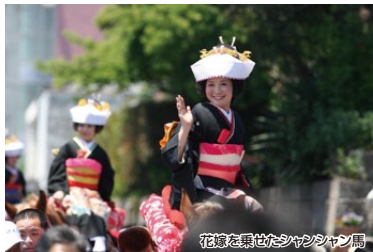
花嫁を乗せたシャンシャン馬

鹿児島県下三大祭りの一つである志布志お釈迦まつりや伝統のある大慈寺、宝満寺等を巡りながら散策し、歴史を感じることが出来るコースです!また、イベントやパレード・踊り連・花嫁を乗せたシャンシャン馬は必見です!